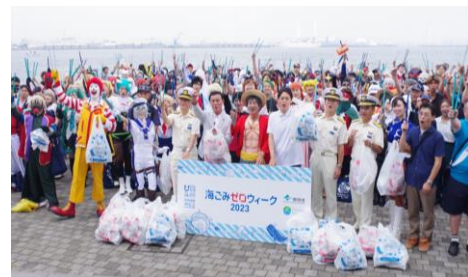
海ごみゼロウィークキックオフイベント

※ 環境省及び公益財団法人日本財団が、平成31年2月から推進している共同事業の1つであり、5月30日（ごみゼロの日）から6月5日（環境の日）を経て6月8日（世界海洋デー）前後までの期間を「海ごみゼロウィーク」として定め、同期間中に海洋ごみ削減に向けた全国一斉清掃活動を行い、その取組結果を世界へ発信する取組です。