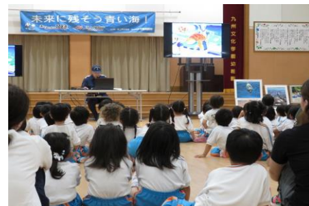
海洋環境保全教室