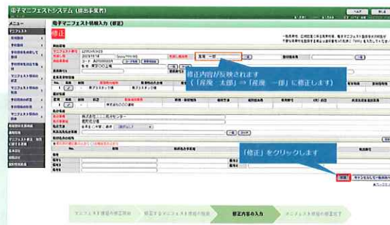
▲マニフェスト情報の修正の一部抜粋