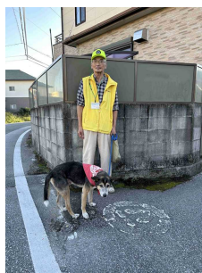
(中央) 活動時における愛犬用のバンダナ

南国市教育委員会では、子どもたちを犯罪や事故から守るため、学校・保護者・地域住民が連携してボランティア活動を推進しています。活動の一つとして、愛犬家の皆さんが、愛犬の散歩の時間やコースを子どもたちの登下校の時間帯や通学路に合わせ、愛犬と散歩をしながら登下校中の子どもたちの安全を見守っています。子どもたちは顔見知りの大人やかわいい犬と触れ合いながら、安心して通学できています。