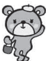
高知県立消費生活センター キャラクター くまっちゃん