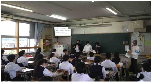
先生役の高校生が中学生に授業を行う様子

生徒会に所属する生徒が先生役となり、土佐市高岡町内にある小・中学校において、「携帯電話の利便性や危険性」、「SNSでのトラブル」等をテーマとして、小中学生に授業を行っています。受け手の小中学生は、身近な高校生が先生ということで、親近感を持って興味深く説明を聞いています。先生役の生徒は、事前にトラブルの現状や説明内容などを研究して当日に臨んでいます。この活動を通じて、先生役の生徒は「誰かのために何かをしたい」「トラブルや被害を防ぎたい」という思いをより強くしています。