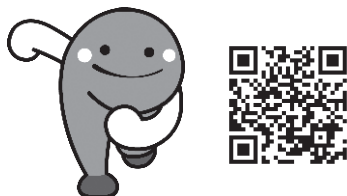
高知県マスコットキャラクター くろしおくん