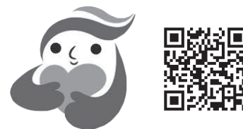
犯罪被害者等支援シンボルマーク ギョッとちゃん