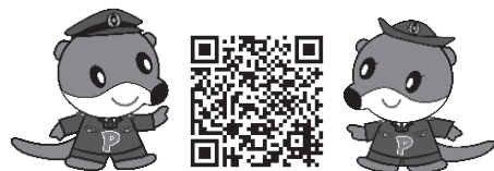
高知県警察マスコットキャラクター ポリンくん ポーリーちゃん