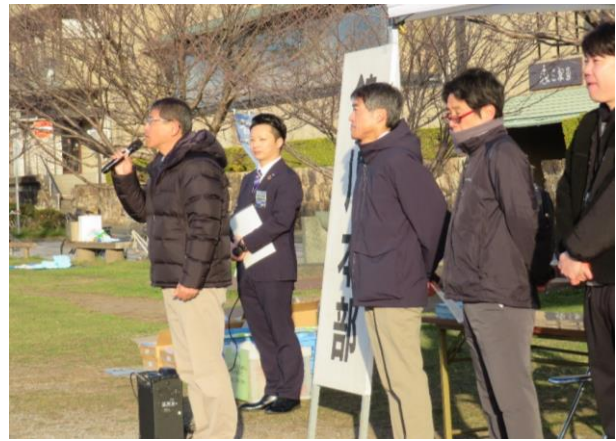
7時20分から開会式がありました。高知市長、高知県土木部長等の挨拶がありました。