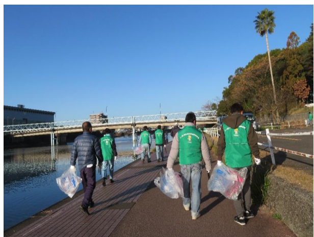
開会式の後、それぞれの場所へ移動して清掃活動を行いました。