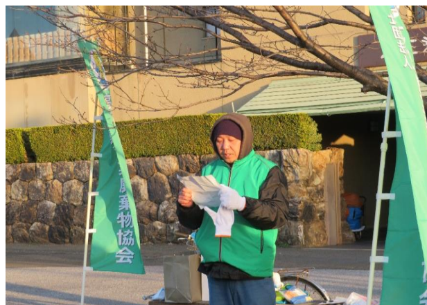
集合は午前7時。中野青年部会長が、挨拶を行い、作業について説明を行いました。